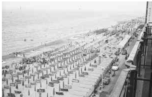
fascia costiera intensamente antropizzata in corrispondenza di Pesaro (Mar Adriatico)