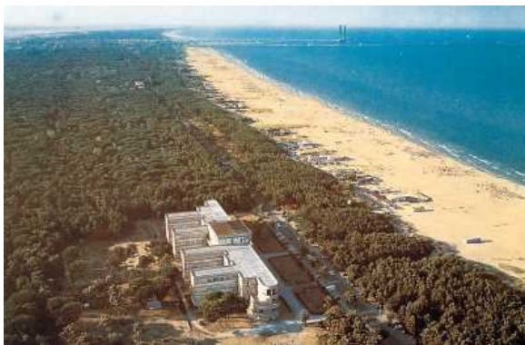
ambiente costiero naturale, in evidenza l'ampio litorale sabbioso, la retrostante fascia di pineta e la scarsa interferenza antropica